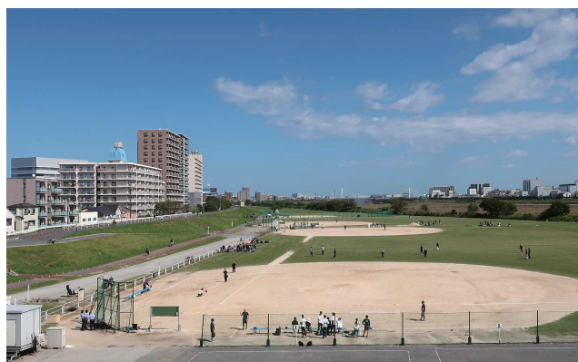
↑大田区多摩川緑地野球場

顧問弁護士による 法律相談 第4木曜日です。 電話にて予約をしてください。 （曜日や時間は調整できます）