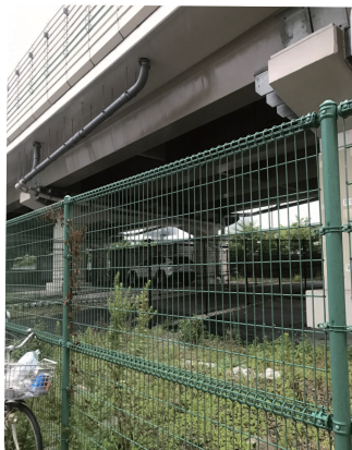
↑手前側は東糞谷6丁目都営住宅。首都高速道路下の旧南前堀を埋め立てて出来た土地。

収容台数 130台 今年度中にモノレール整備場駅と三井不動産ビルとの間の海老取川に人道橋が完成する。自転車は通行できないため駅利用者が増加することを想定し新設する。当面無料とする。