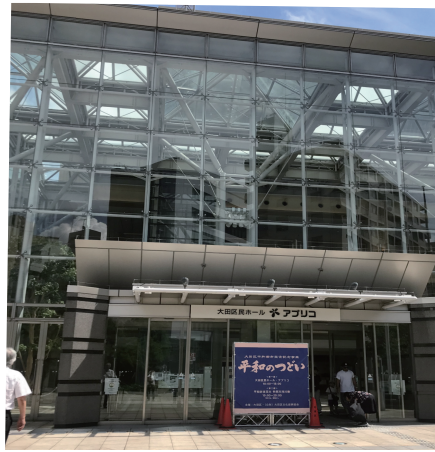
↑アプリコホール 「平和のつどい」を開催

79年目の終戦の日、また、大田区平和都市宣言40年目。本年は多摩川花火大会だけでなく、アプリコホールにおいて午前10時から平