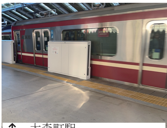
↑ 大森町駅 完成しています！（写真は工事中）