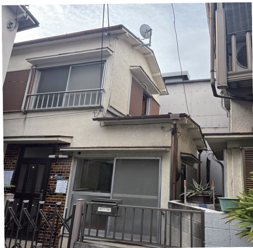
↑ 木造住宅が立ち並ぶ、一番奥の空き家が 民泊予定